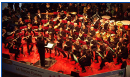
Nantes Philharmonie, Folle Journée