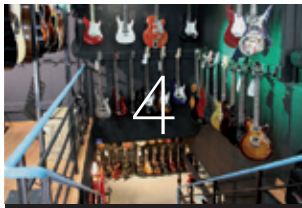
guitares - amplis - effets : 4 studios d'essai